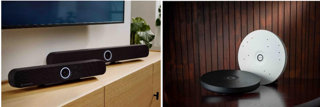
Sennheisers Lösungen der TeamConnect Familie

Besucher*innen haben auch die Möglichkeit, Sennheisers drahtlose Lösungen für Unternehmen und Bildungseinrichtungen auszuprobieren, darunter EW-DX , die neueste Ergänzung zur Evolution Wireless Digital-Familie, und MobileConnect , die bidirektionale Lösung für klares Hören, einfaches Antworten und Live-Interaktion, in Live-Demos kennenzulernen.